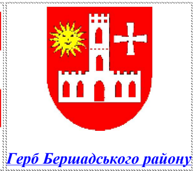
Герб Бершадського району

Дорога до Бершаді стрімко прорізує оточуючі ліси, неначе ділить їх навпіл. Зліва за деревами виблискує ставкове плесо, справа здіймаються у небесну блакить зеленим верховіттям сосни.