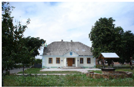
Музей Прокіпа Колісника

Взагалі, тут живе і творить багато талановитих людей, які зберігають для нащадків зразки кращих духовних народних традицій. До цієї когорти належить і молода талановита вишивальниця Любов Атаманенко. В сільській бібліотеці оформлена виставка, на якій представлені чудові зразки її художньої вишивки – старовинне золотошвейне шиття, а також малюнки, на яких зображено зразки орнаментів Київської русі, Візантії та Єгипту.