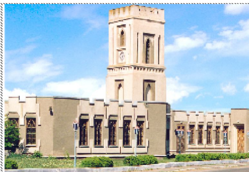
Вежа с. Баланівка

Декілька століть млин вірно служив людям. Стоїть він величний та прекрасний і нині.