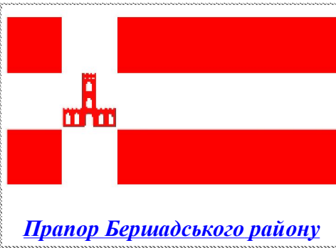
Прапор Бершадського району