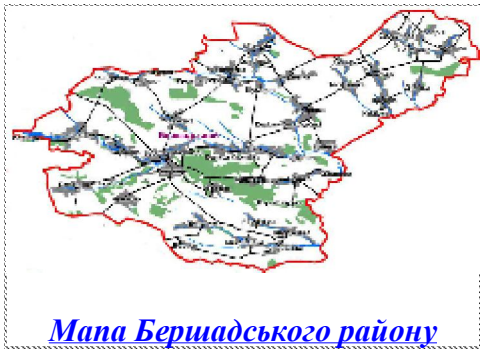
Мапа Бершадського району